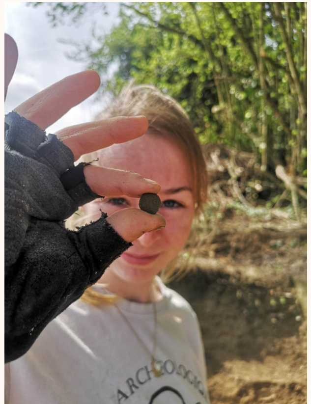
Photo 1: Monnaie trouvée pendant le chantier de printemps