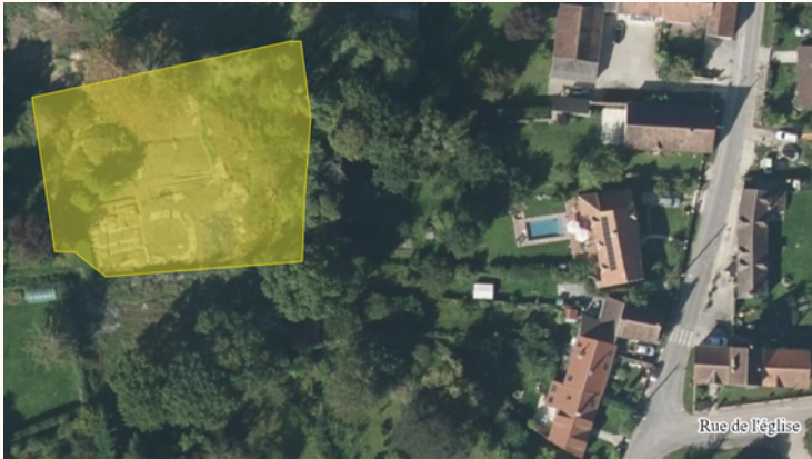
Carte 2 : Localisation de la fouille programmée.

Cette année, les investigations se poursuivent pour une dernière campagne. Elle aura pour objectifs le dégagement du fossé de péribole oriental dans l'angle sud-est des parcelles A 660-663 et de la suite des bâtiments sur solins dans l'angle nord-est.